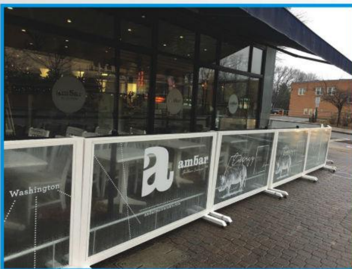
BALCAN CONCEPT WASHINGTON, USA

Prednosti ovog tipa ograda su višestruke: